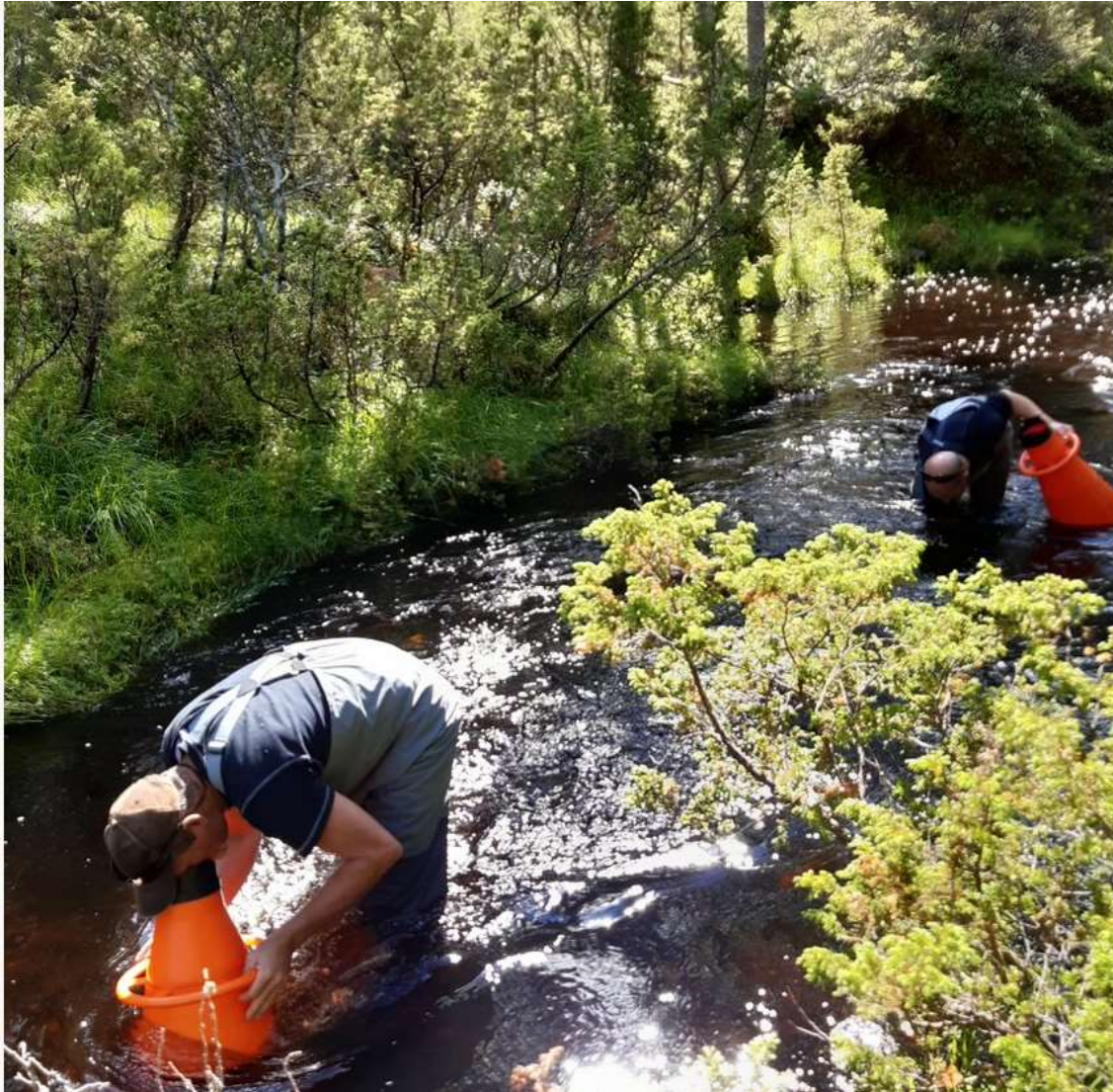
Figur 8. Stor variasjon i bredde og dyp i Vollelva. Her foregår plukking ved et smalere elveparti.