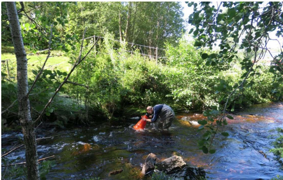
Figur 5. Stor vannføring i Svankilelva.

Vannføringen under feltarbeidet var høy (Figur 5), antageligvis som følge av store nedbørsmengder ikke lenge i forveien. Vegetasjonen langs vassdraget bar preg av flomvannføring for kort tid siden. Tross at feltarbeidet ble gjennomført i klarvær og sol var sikten i vannet middels god som følge av mye farge. Minste observert musling var 60 mm. Grunneier uttalte at det er færre muslinger nå enn tidligere.