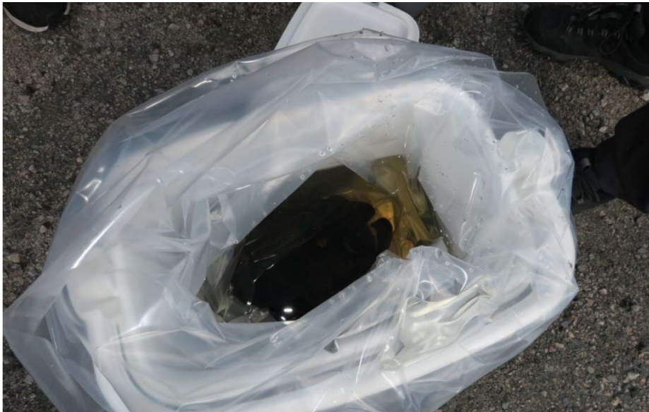
Figur 2. Pakking av elvemusling fra Svankilelva.