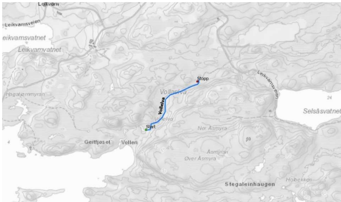
Figur 6. Elvemusling ble plukket fra UTM32V 484802, 7052100 til UTM32V 485098, 7052378 i Vollelva.

Feltarbeidet ble gjennomført av Gaute Stolsmo Haukdal, Jørulf Vullum og Martin Hanssen den 13.07.2020. Uttaket av elvemusling startet kl. 14:37 og avsluttet kl. 15:57. Muslingene ble plukket over en strekning på 480 meter. Feltarbeidet startet ca. 20 meter oppstrøms foss som antas å være naturlig vandringshinder (se Figur 6 og Figur 7).