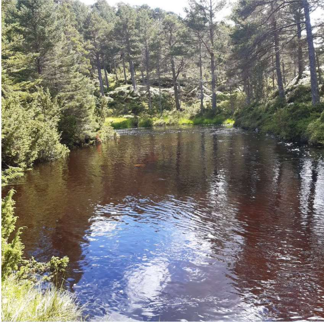
Figur 7. Bilde tatt ved starten av feltarbeidet i Vollelva, like oppstrøms vandringshindret. Første musling plukket rundt elvesvingen til venstre. Her er elva forholdsvis bred. Mye farge i vannet.