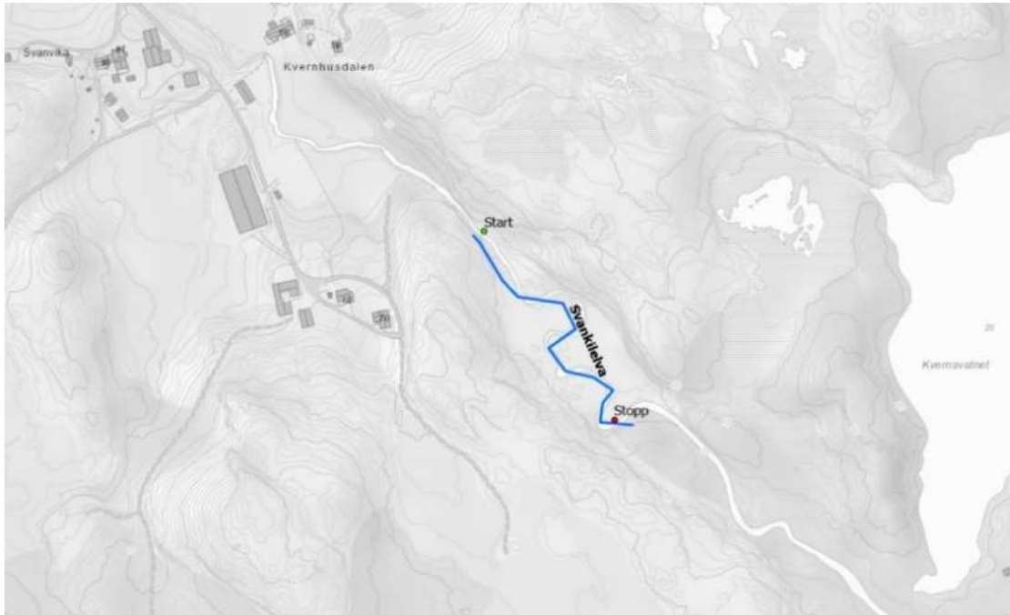
Figur 4. Elvemusling ble plukket fra UTM32V 472155, 7044180 til UTM32V 472256, 472256 i Svankilelva.

Vannføringen under feltarbeidet var høy (Figur 5), antageligvis som følge av store nedbørsmengder ikke lenge i forveien. Vegetasjonen langs vassdraget bar preg av flomvannføring for kort tid siden. Tross at feltarbeidet ble gjennomført i klarvær og sol var sikten i vannet middels god som følge av mye farge. Minste observert musling var 60 mm. Grunneier uttalte at det er færre muslinger nå enn tidligere.