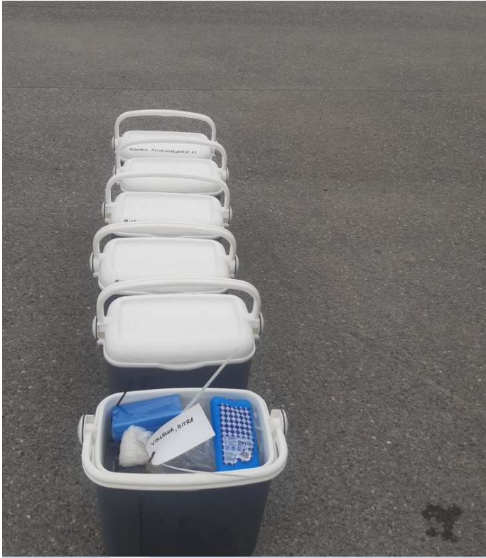
Figur 1. Elvemuslinger nedpakket og klare for transport.